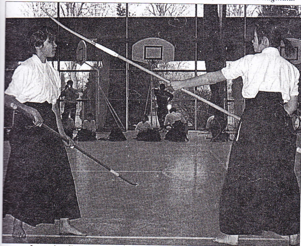
La section d'arts martiaux de la ville regroupe près de soixante enfants.

Samedi matin, les élèves du groupe scolaire de Chèvreloup ont assisté à une démonstration des trois sections d'arts martiaux de la ville. Zoom sur le naginata.